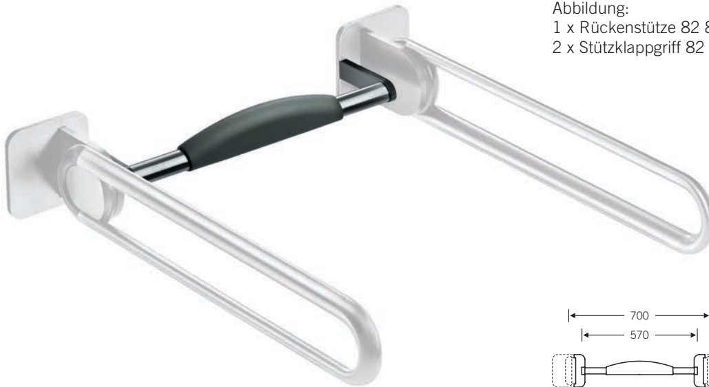
Abbildung: 1 x Rückenstütze 82 8247 2 x Stützklappgriff 82 8224

Sonderausführung in Kombination mit Haltegurt 82 8290 00011 auf Anfrage möglich. Bei Kombination mit Stützklapp- griff 82 8224 bitte Hinweis bei Bestellung.